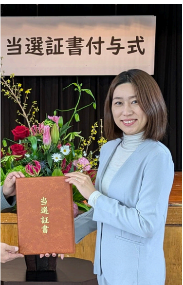
【当選証書授与式の写真】

今回、「争点は誰かが決めるのではなく、市民が決める」という当たり前が形になったと感じました。寒さの中で投票率が下がってしまったのは残念ですが、それでも市民は「既存の枠組みにとられない現役世代・子育て世代に政治を変えてほしい」という意思を示してくれました。